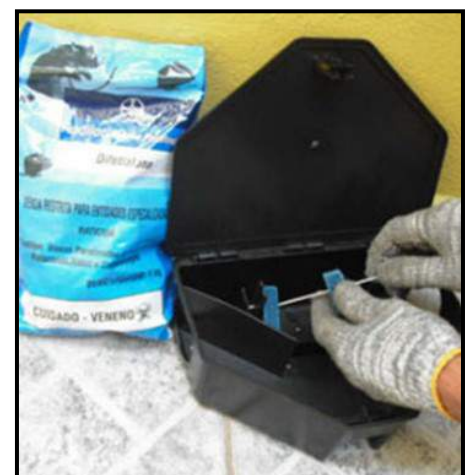
Monitoramento de Porta-isca

A isca será reposta quando verificado consumo e/ou perda de atratividade.