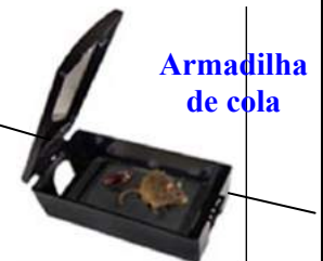
Armadilha de cola

Instalação Armadilhas de Cola (objetiva a captura de roedores por meio de uma placa adesiva) nas áreas internas das edificações da planta fabril. A distância entre cada dispositivo é entre 08 a 12m, seguindo a norma do fabricante. Na existência de portas e portões, são instalados em ambos os lados.